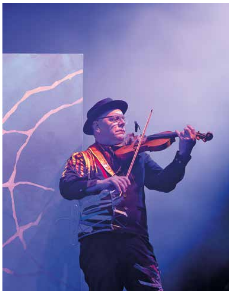
Dans MOI , les musiciens prennent entièrement part au spectacle.

Malgré une carrière internationale, c'est bien à La Chaux-de-Fonds que tout a commencé. Agé de 13 ans, il obtient son premier certificat de violon au Conservatoire de Musique. Revenir jouer dans sa ville natale: «Une réjouissance! J'ai apprécié vivre dans cette ville, qui est tellement active dans le milieu culturelle. Je pourrais ré-emménager ici sans soucis!