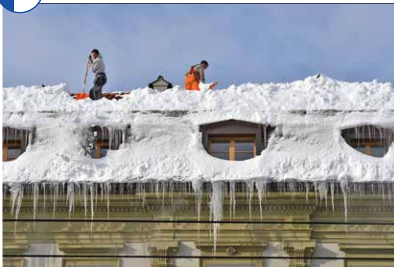
Le déblaiement engendre une disparité entre les communes de > 800 mètres et les autres.