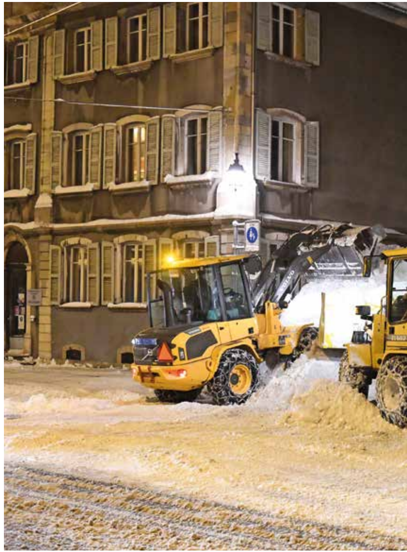
En altitude, les engins de la voirie se déprécient plus vite!

Questionné sur le contre-projet du Conseil d'Etat, Julien Gressot membre du comité d'initiative, se dit soulagé que le Conseil d'Etat voit enfin jour après avoir nié les disparités entre communes de plus de 800 mètres et les autres. Pour le co-président, l'argent fédéral doit être redis-