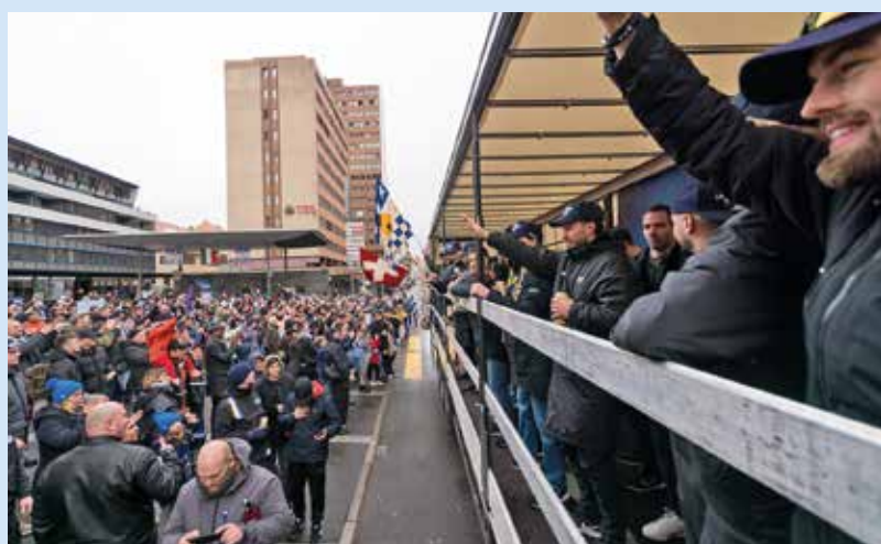
Sur un camion remorque, les Abeilles ont défilé sur le Pod.