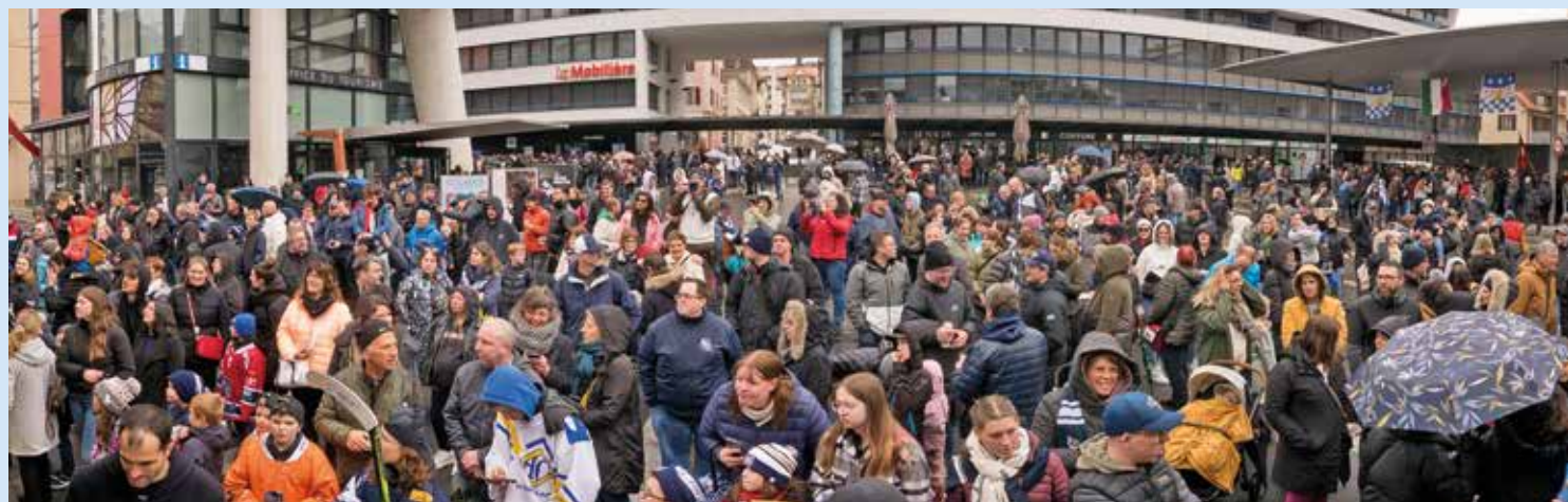
Des milliers de fans sont venus célébrer devant la tour Espacité, sous la pluie.