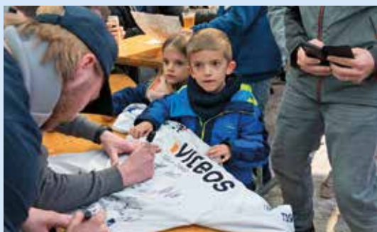
Il n'y a pas d'âge pour supporter le HCC.