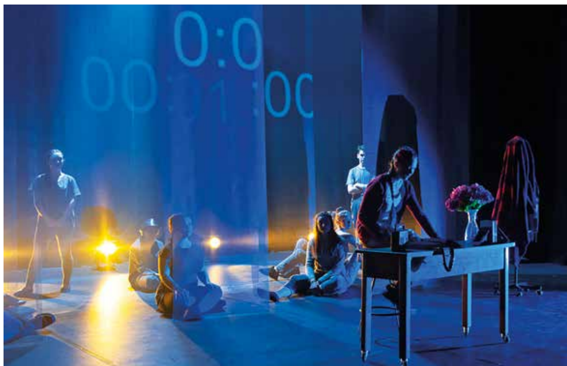
Spectacle 00:01", Collège Nouvelles Frontières (Québec), en 2019.