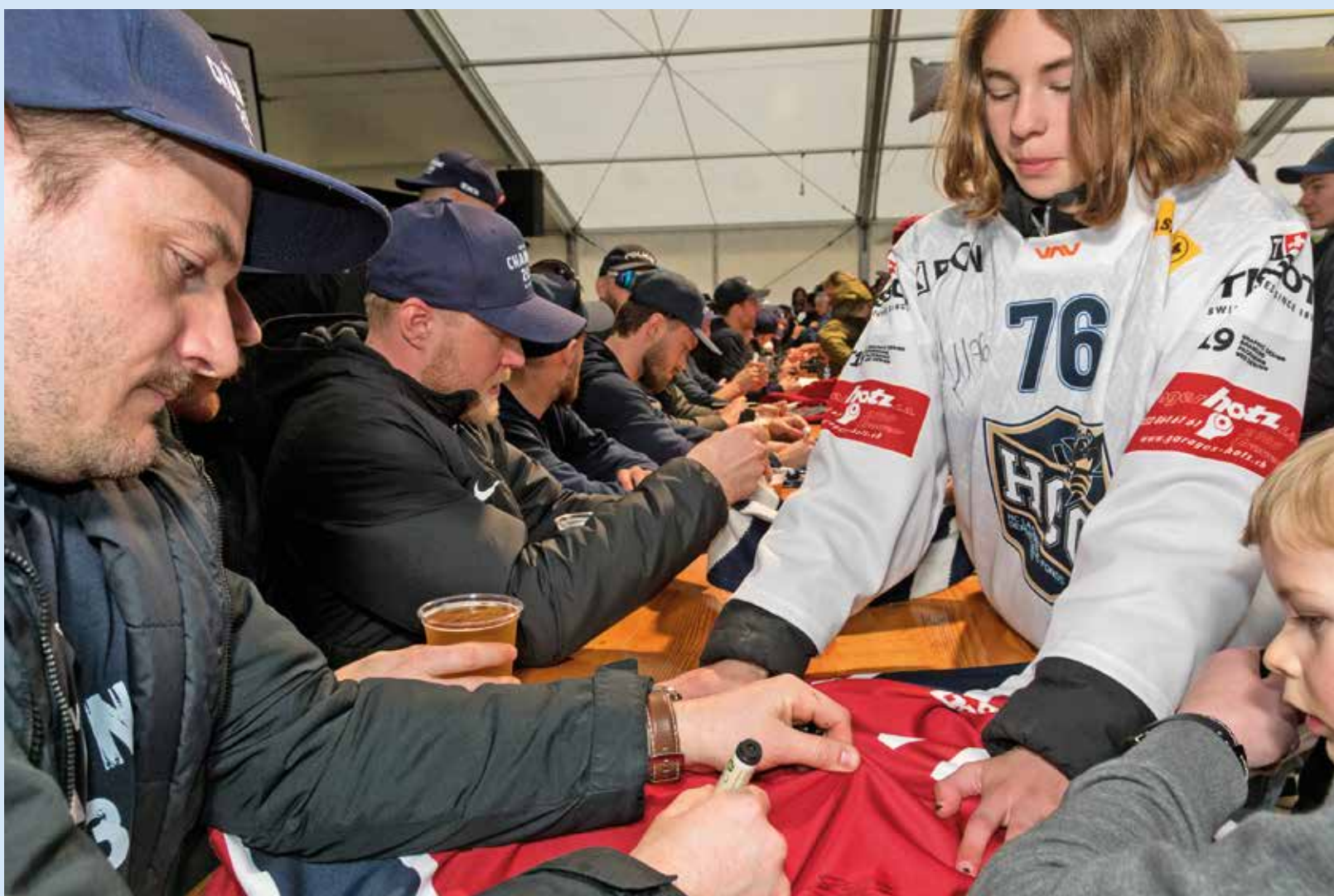
L'occasion pour les fans de rencontrer leur joueur préféré.