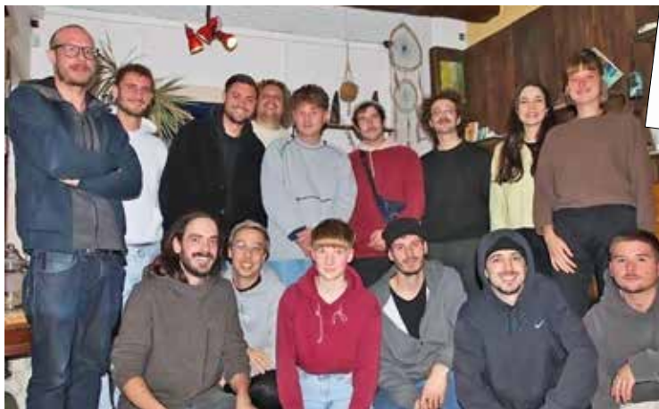
Tous les membres mettent la main à la pâte pour la gestion des travaux.

Des valeurs qui se retrouvent à la base du collectif, adoptant une structure de gouvernance partagée. «La philosophie associative et l'intelligence collective sont au centre du projet. On se base sur la charte Mycélium (ndlr: document fondateur du Réseau Mycélium), prônant la durabilité, le respect, l'horizontalité des membres et l'apprentissage constant.»