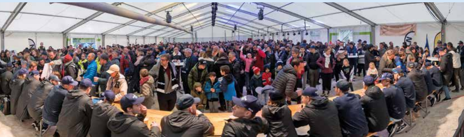
La foule s'est ensuite déplacée à la fan zone des Mélézes pour une séance dédicaces.