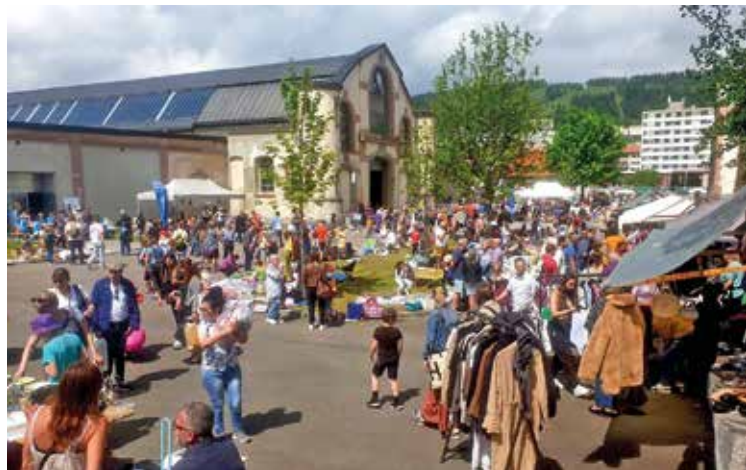
Même déplacée aux Anciens abattoirs l'an passé, la Fête de mai avait rencontré un grand succès.

Après une édition spéciale aux Anciens abattoirs l'an passé en raison du Covid, qui avait toutefois rencontré un large succès, la Fête de mai revient en vieille ville pour son 40 e anniversaire. Cette traditionnelle fête de printemps, célébrant les vins de la Ville et la donation par Alfred Olympi de ses vignes à Auvernier, se tiendra sous la forme d'une seule journée et soirée, samedi 13 mai.