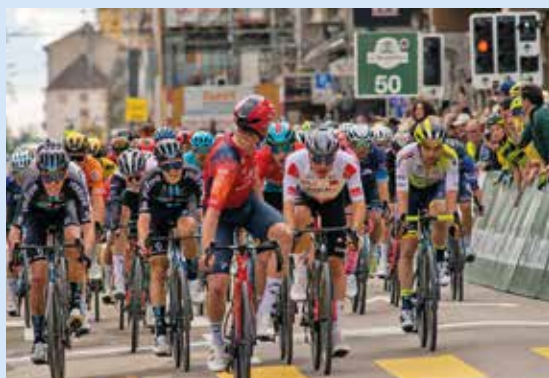
Le Britannique Ethan Hayter (Ineos Grenadier) l'emporte!