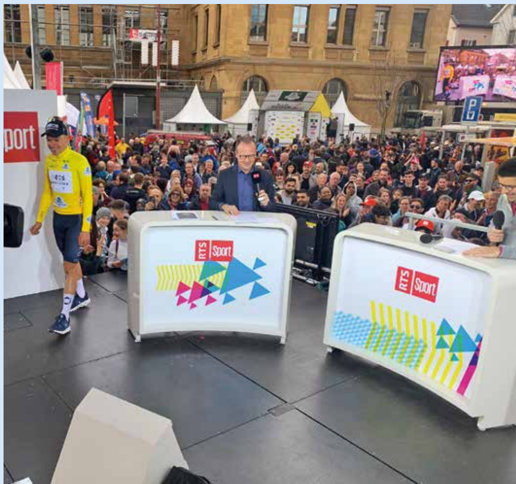
L'occasion de passer à la TV avec le plateau de la RTS, installé sur la place de la Gare.