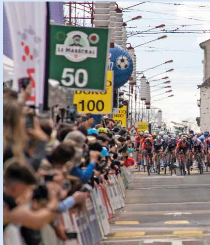
Quelle ambiance! Et quel monde sur le Pod pour assister au sprint massif.