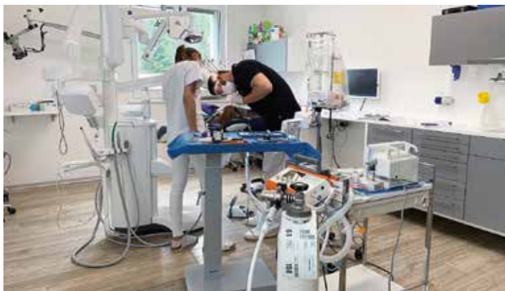
Le matériel ambulatoire peut être transporté chez les dentistes lors d'interventions spéciales

L'équipe administrative de Fly Anesthesia, dans ses locaux à Marin, gère la coordination des journées, la planification des médecins et infirmiers-ères anesthésistes, l'organisation du matériel ainsi que la facturation des prestations médicales reconnues par toutes les assurances maladie et accident.