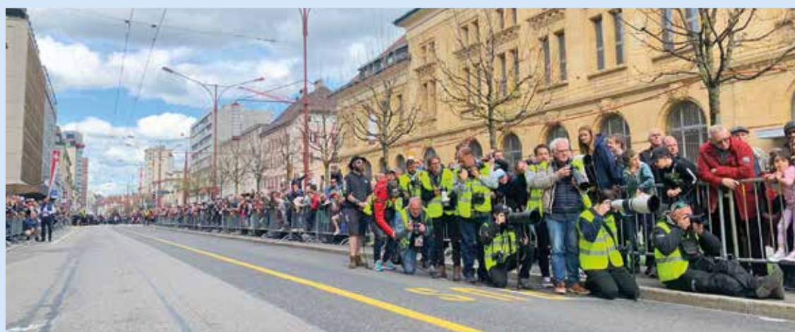
Le TDR (130 chaînes de TV) une formidable caisse de résonance médiatique. (gs)