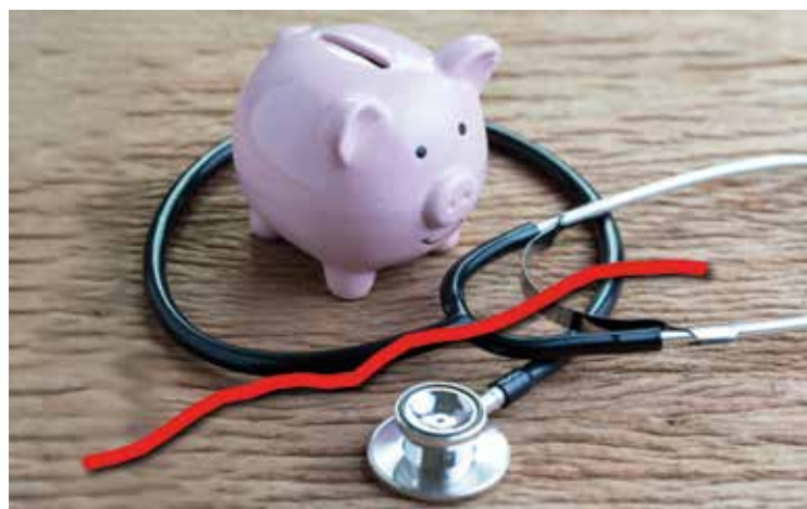
Les primes d'assurance maladie ne cessent d'augmenter. Ici, un graphique de 1999 à aujourd'hui. (Illustrations et données : OFS)

Limiter à 10% les coûts de l'assurance maladie, sans tenir compte des aides déjà disponibles ou augmenter la déduction fiscale sur la feuille d'impôts, ce n'est rien d'autre qu'admettre que le système de santé fonctionne alors que justement il dysfonctionne. Dans le grand supermarché de la santé, la hausse des coûts est permanente en raison du manque d'efficacité et de coordination. On entend souvent la droite mettre la faute sur l'interventionnisme de l'Etat sublimé par un bouclier social nommé CCT21 et la gauche répondre que le système est malade et que les privés ne s'intéressent qu'aux missions les