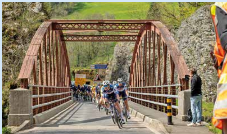
Le pont de Biaufond, aussi appelé le pont de la Paix: tout un symbole.