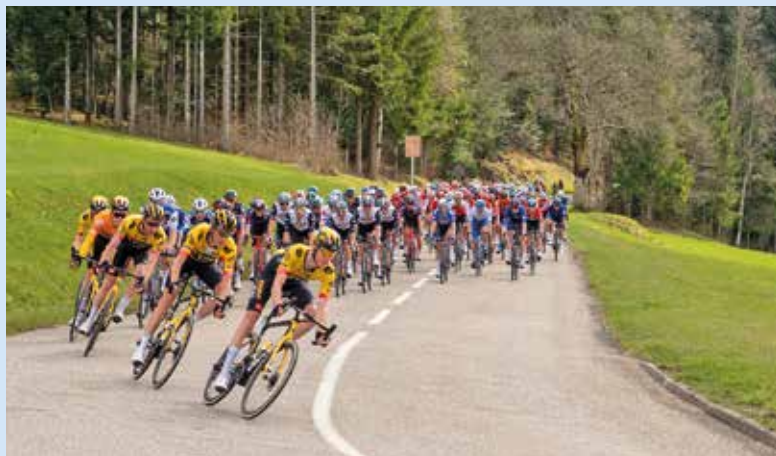
Le peloton dans la descente du Communal.