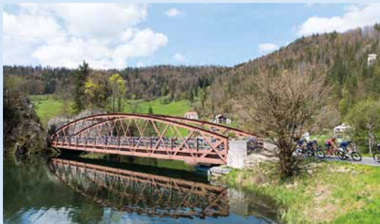
Entrée en Suisse en enjambant le lac chaux-de-fonnier (et oui!) de Biaufond.