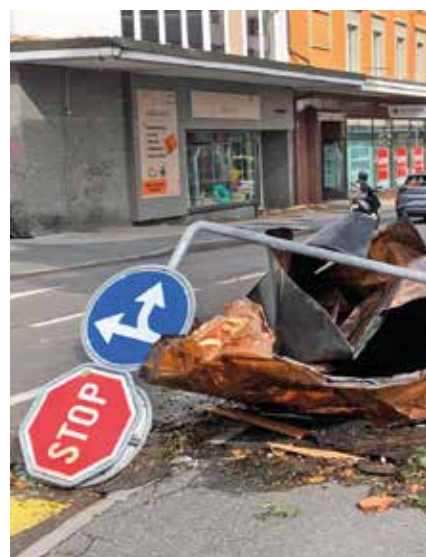
Le Pod, les rues et des entrées de garage arrachés. Des témoins ont cru découvrir

L'originalité et la puissance de ce documentaire exceptionnel trouve aussi sa force dans l'exploitation du matériel vidéo filmé et collecté le jour de la catastrophe. Vidéos amateurs, caméras de surveillance, images filmées par les caméras équipant les véhicules des premiers secours et des patrouilles de police.