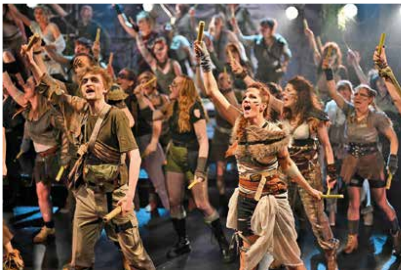
La chorale Rocking Chair 2023, Sauvage!