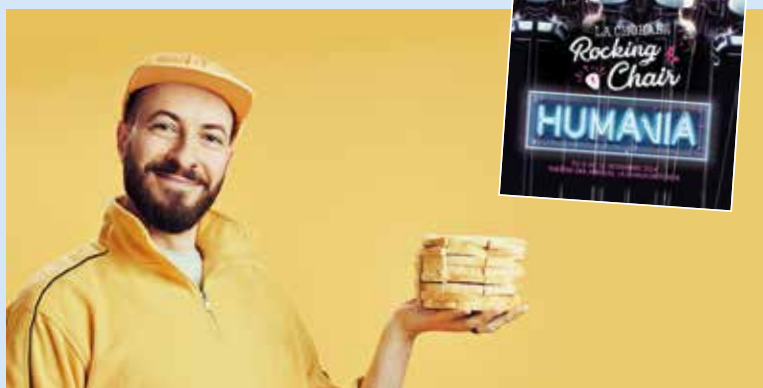
L'humoriste Blaise Bersinger présente Pain Surprise . (À la Volette)