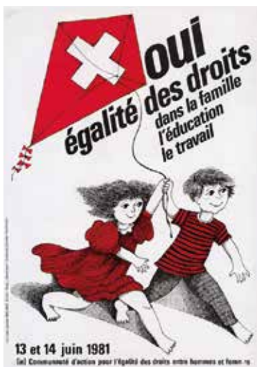
L'affiche pour l'égalité de 1981. (© Zürcher Hochschule der Künste)