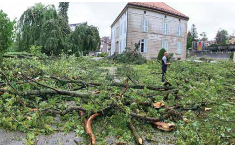
de la Métropole horlogère: le parc des Musées juste après le passage de la tempête,