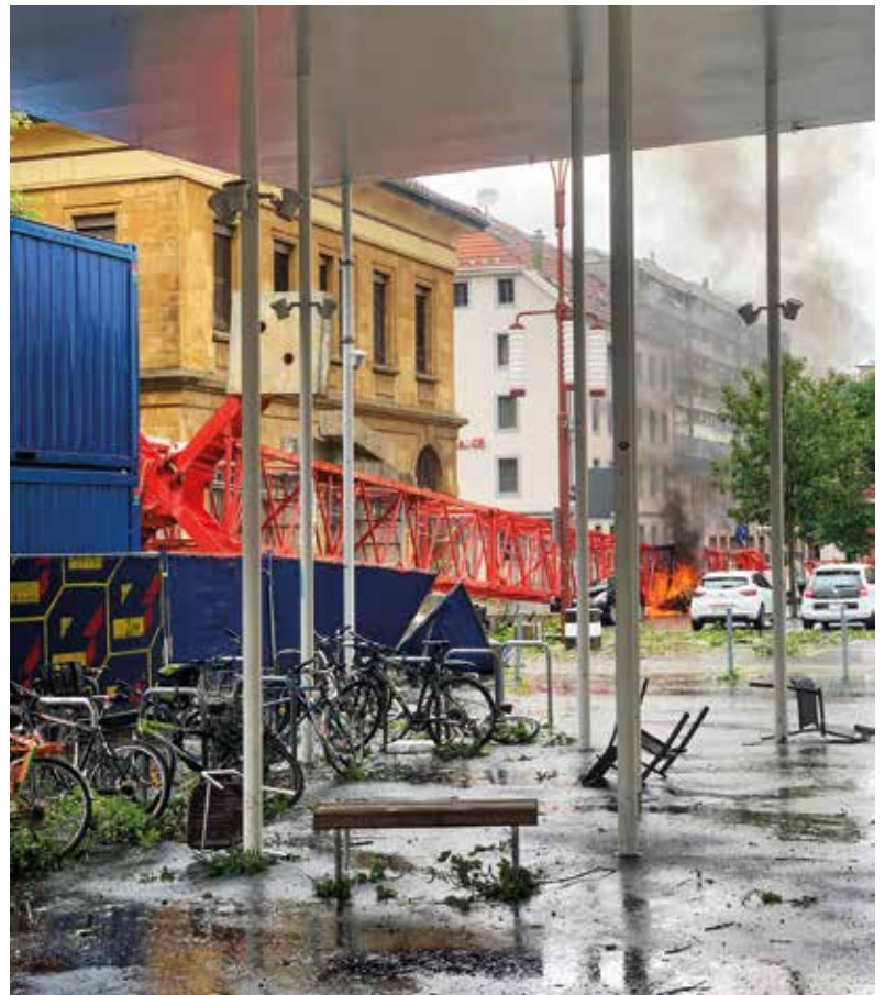
Moment fort de ce Temps Présent, le témoignage de la compagne de l'homme tué par la chute de la grue sur sa voiture qui a pris feu.