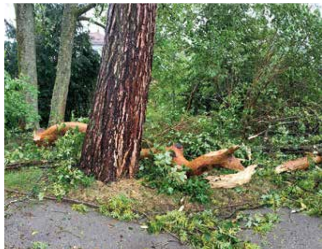
Une des images emblématiques de l'hécatombe subie par les arbres qui a cisailé des troncs.