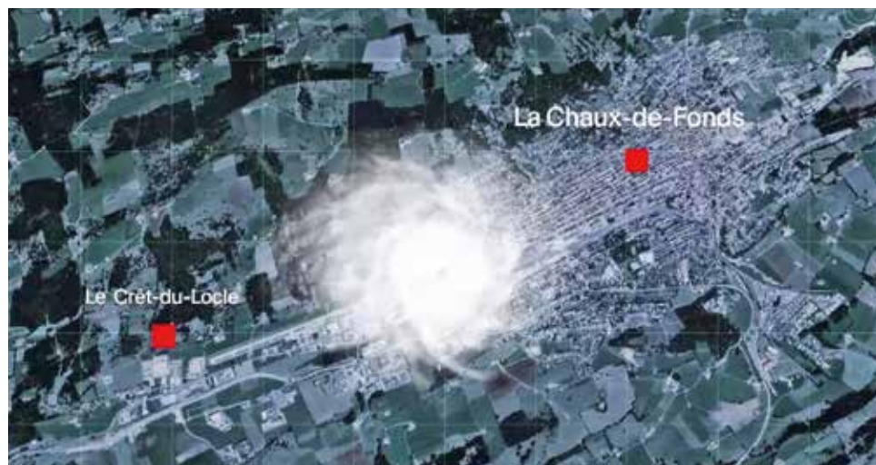
Le Ô vous dévoile cette image satellite inédite de Météo Suisse, proposée dans le documentaire de la RTS.

On constate les dégâts hors norme qui donnent une force documentaire qui s'approche au plus près de la vérité. L'approche du magazine donne l'immense privilège de prendre de la hauteur et du recul sur les événements. »