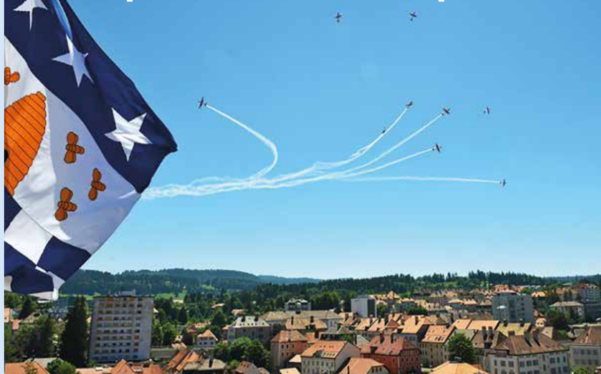
La patrouille suisse et ses PC7 est venue survoler les deux villes pour honorer leur urbanisme horloger vu du ciel!

«Le 27 juin 2009, les cloches des villes du Locle et de La Chaux-de-Fonds résonnaient toutes en même temps, marquant l'inscription des deux villes sur la liste du patrimoine mondial de l'UNESCO dans le cadre du congrès de l'UNESCO à Séville en Espagne.» Le site www.urbanismehorloger.ch rappelle ce moment historique.