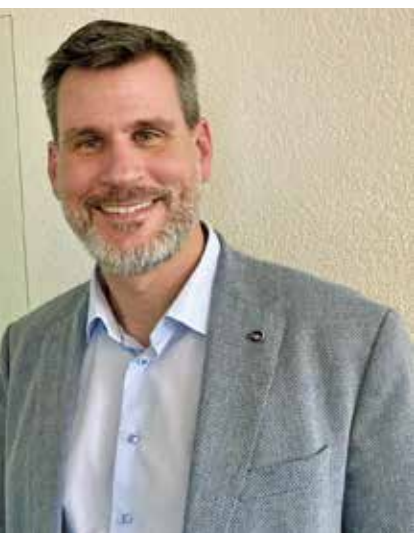
Viteos, a commencé sa carrière par un ap-

DIRECTEUR GÉNÉRAL DE VITEOS, QUI ABORDE POINTS CHAUDS EN MATIÈRE D'ÉNERGIE