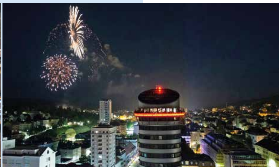
Eclipse VI, une performance collective, a animé le Pod avant le feu d'artifice au-dessus de la ville. En étiez-vous ?