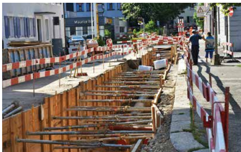
Les grands chantiers du chauffage à distance, un levier important de la transition énergétique.