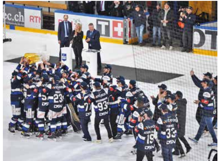
Triomphe sur la glace et bilan bénéficiaire : un joli doublé du HCC, même si la tension demeure sur le front des finances.

Le club veut faire aussi bien la prochaine saison. Terminer parmi les quatre premiers et participer aux demi-finales, voir sortir