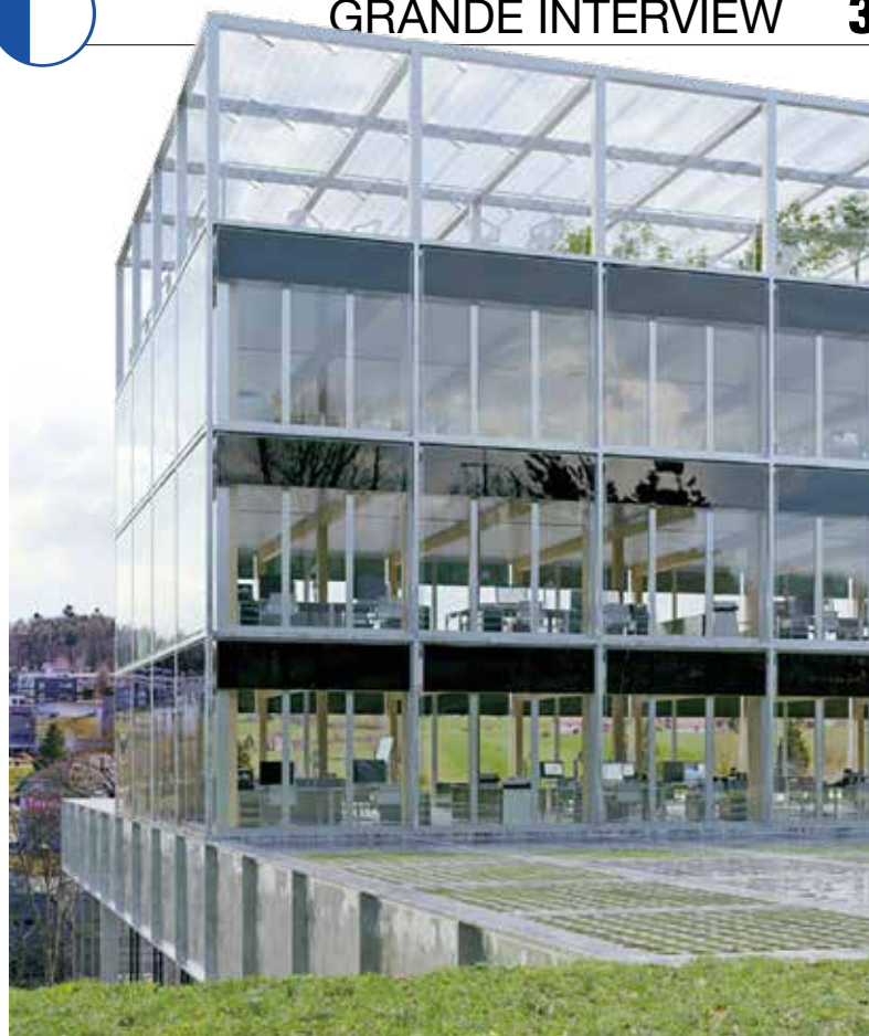
Le nouveau bâtiment principal de Viteos qui sera construit rue de l'Hôtel-de-Ville.

sur les chiffres, mais oui! En Suisse on consomme 60 terawattheure, on sera entre 80 et 100 à l'horizon 2050! Malgré les progrès en matière d'efficacité, l'augmentation est liée à l'électrification des voitures, du chauffage, et aussi à l'augmentation de la population.