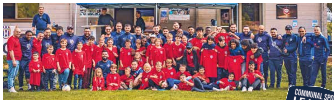
Le FC CSL et le FC Ticino avancent main dans la main vers la promotion du sport et du foot local (Meho Delic)

Grâce à un partenariat fructueux avec le FC Ticino, le FC CSL a élargi sa base de supporters et a renforcé sa visibilité dans la communauté locale. Cette collaboration a aussi permis d'attirer l'attention sur ses valeurs fondamentales : le respect et l'engagement envers l'excellence sportive. Le club se prépare à rejoindre la 2 e ligue et a des ambitions claires