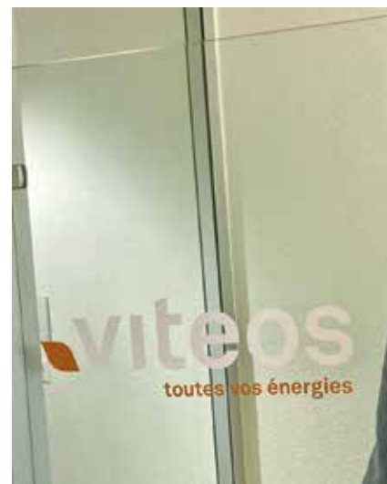
Daniel Pheulpin, le big boss ajoulot de prentissage.

- Pourquoi les tarifs ont encore augmenté de 23% en 2024, après la forte