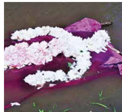
À voir au MBAC, « Flower Person, Flower Body », 1975, Ana Mendieta.

Musée. Vernissage de trois nouvelles expositions au MBA La Chaux-de-Fonds samedi 29 juin dès 17h. Entrée libre. www.mbac.ch .