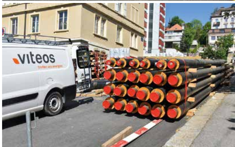
Braderie, fête des Vendanges... Avec Viteos, les grandes manifestations sont... branchées!