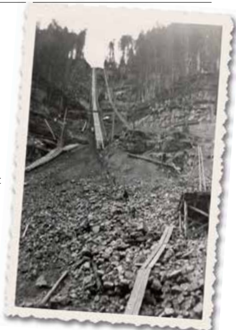
Les travaux sur le funiculaire ont mené la vie dure à la cinquantaine d'ouvriers sur place.

Une pelle mécanique est transformée en «dragueline» pour commencer la correction du lit du Doubs. Ce travail est entrepris par la maison Marty de Berne. Il s'étend sur une longueur de 100