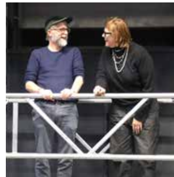
« Non mais ils ont vraiment cru qu'on allait rester là à rien faire ? »