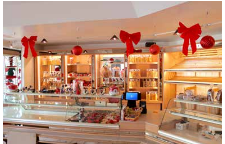
Quelques heures avant l'ouverture, les vitrines s'égayaient gentiment de leurs nouveaux produits.