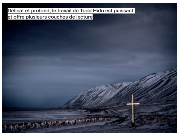
Délicat et profond, le travail de Todd Hido est puissant et offre plusieurs couches de lecture

« Nous avons sollicité des artistes venant d'horizons variés afin de refléter la richesse du répertoire de Miles Davis. L'objectif est de créer des passerelles entre les univers, d'explorer de nouvelles possibilités et de bousculer les codes tout en préservant l'essence de son œuvre. Travailler avec ces artistes est très enrichissant, chacun partage son savoir-faire. Les deux jours de résidence au CMNE permettront d'affiner progressivement ce projet, qui restera en constante évolution jusqu'au jour du concert. »