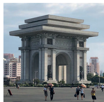
L'arc de triomphe à Pyongyang : un monument gigantesque de propagande dédié à la gloire du régime communiste nord-coréen. Avec ses 60 mètres de hauteur, il dépasse de 10 mètres celui de Paris.

Il y a peu de touristes car ça semble peu accessible. En Corée du Nord, ils vous prennent votre passeport. Pour aller dans ce pays, j'ai contacté deux agences de voyage qui m'ont délivré des papiers à Beijing. C'était le début d'une incroyable découverte. Incroyable, ça n'est pas forcément positif car ça reste un régime totalitaire affreux.