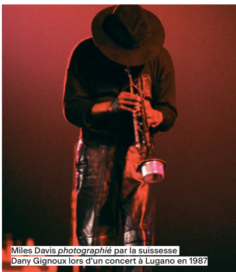
Miles Davis photographié par la suisse Dany Gignoux lors d'un concert à Lugano en 1987