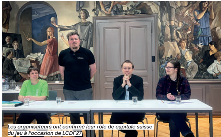
Les organisateurs ont confirmé leur rôle de capitale suisse du jeu à l'occasion de LCDF27

Qui peut encore ignorer Ludesco, le plus grand festival de jeux et d'expériences ludiques de Suisse qui attire toutes les générations et déplace les foules ? En tous cas pas les plus de 10 000 participants attendus pour la 17 e édition. Qu'on ne se s'y trompe pas, Ludesco n'est pas que le must du genre des joueurs, c'est aussi le rendez-vous des concepteurs, avides de faire découvrir leurs créations.