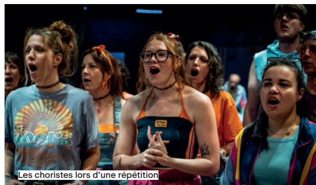
Les choristes lors d'une répétition