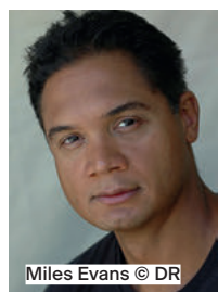
Miles Evans © DR