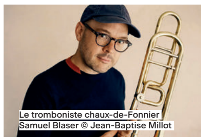
Le tromboniste chaud-de-Fonnier Samuel Blaser