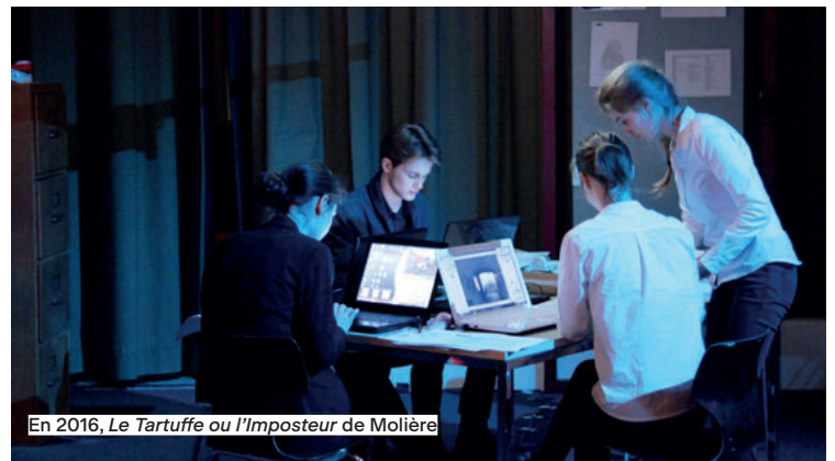
En 2016, Le Tartuffe ou l'Imposteur de Molière