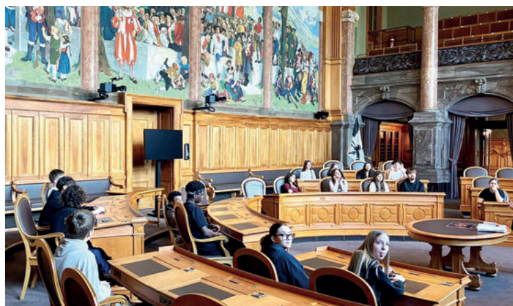
Des jeunes au Palais fédéral