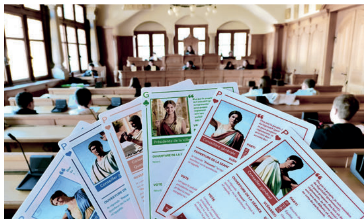
Jeu de rôle : la politique par immersion