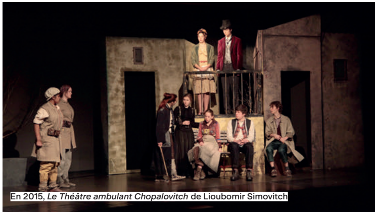
En 2015, Le Théâtre ambulant Chopalovitch de Lioubomir Simovitch