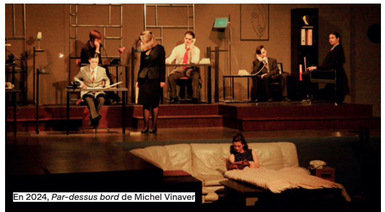
En 2024, Par-dessus bord de Michel Vinaver