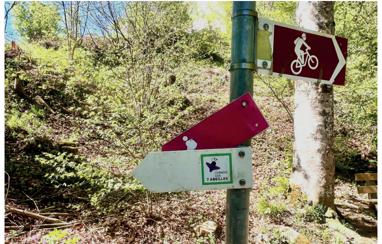
Panneau indicateur reconnaissable à sa couleur