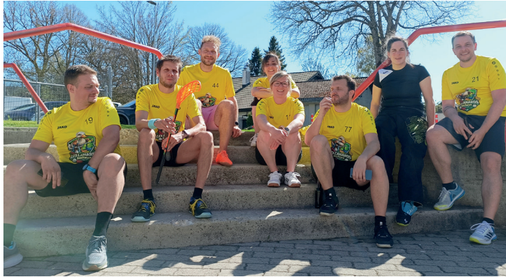
L'équipe des « Canards boiteux » prennent le soleil « hors de l'eau ».