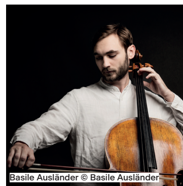
Basile Ausländer © Basile Ausländer