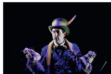
Malevolo © Francois Passerini