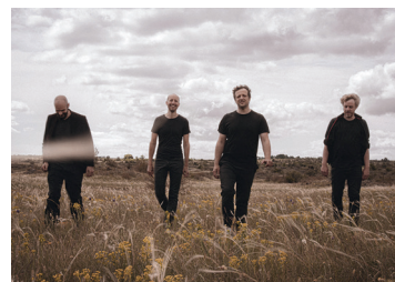
iAROSS © Delphine Chomel