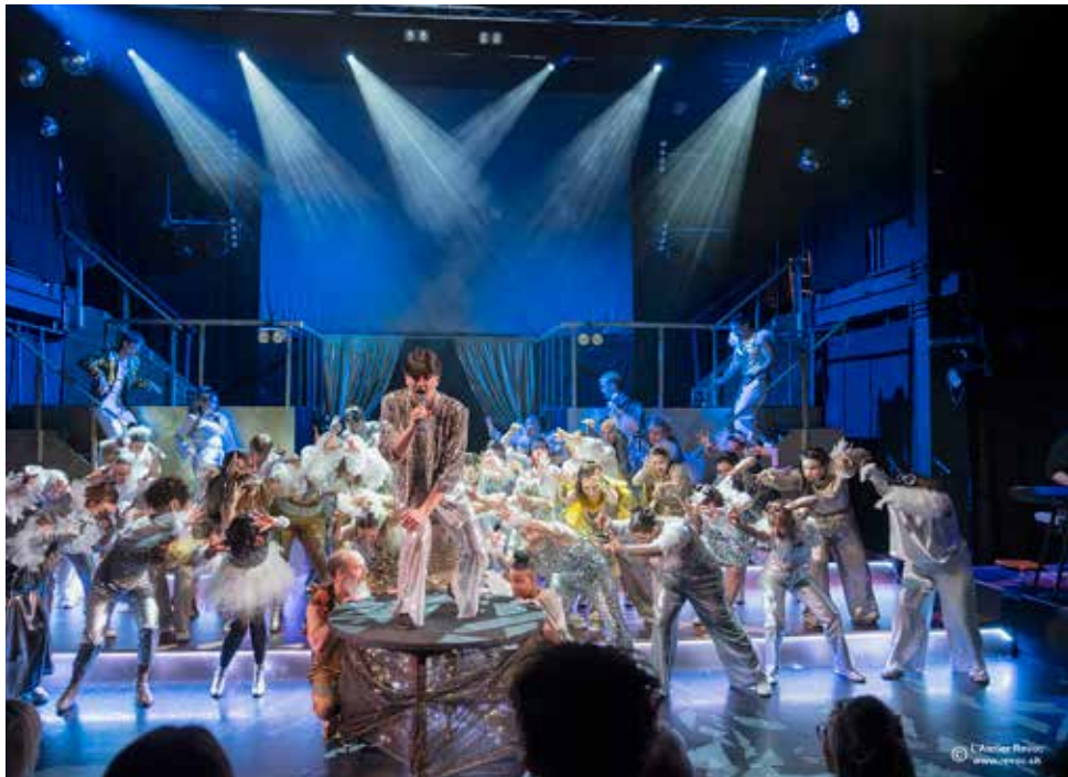
La chorale Rocking Chair