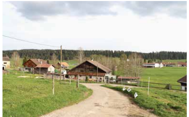
Soleil et dynamisme semblent planer sur les comptes de la vallée de La Brévine

À La Brévine, le constat est plus réjouissant que prévu. Alors que le budget prévoyait une perte de 139 000 francs, les comptes se soldent finalement par un bénéfice de 46 500 francs. Au vu de la nouvelle répartition entre les communes, « les impôts sur les personnes morales et physiques sont nettement plus importants », relève