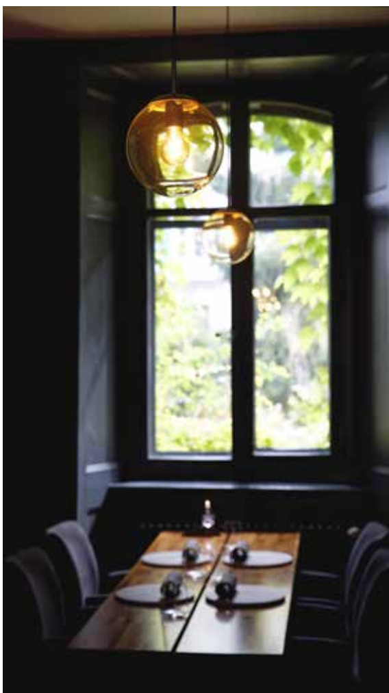
La Luciole, une atmosphère intimiste pour une dizaine de convives

près de 50 % de CO 2 en moins qu'un régime omnivore.