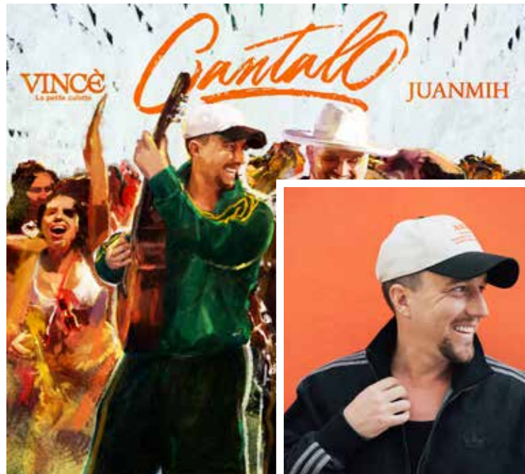
La pochette de Cantalo Vincè la petite culotte