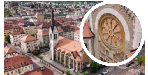
Le théâtre des Abeilles vu du ciel

La rosace, située sur la façade du bâtiment, constitue l'un des éléments les plus emblématiques de ce lieu chargé d'histoire. Attribuée à Clement Heaton, maître-verrier d'origine britannique associé aux mouvements Art nouveau et Arts & Crafts, elle possède une valeur patrimoniale importante. Son état actuel fragilise une partie de la façade et nécessite une intervention spécialisée.