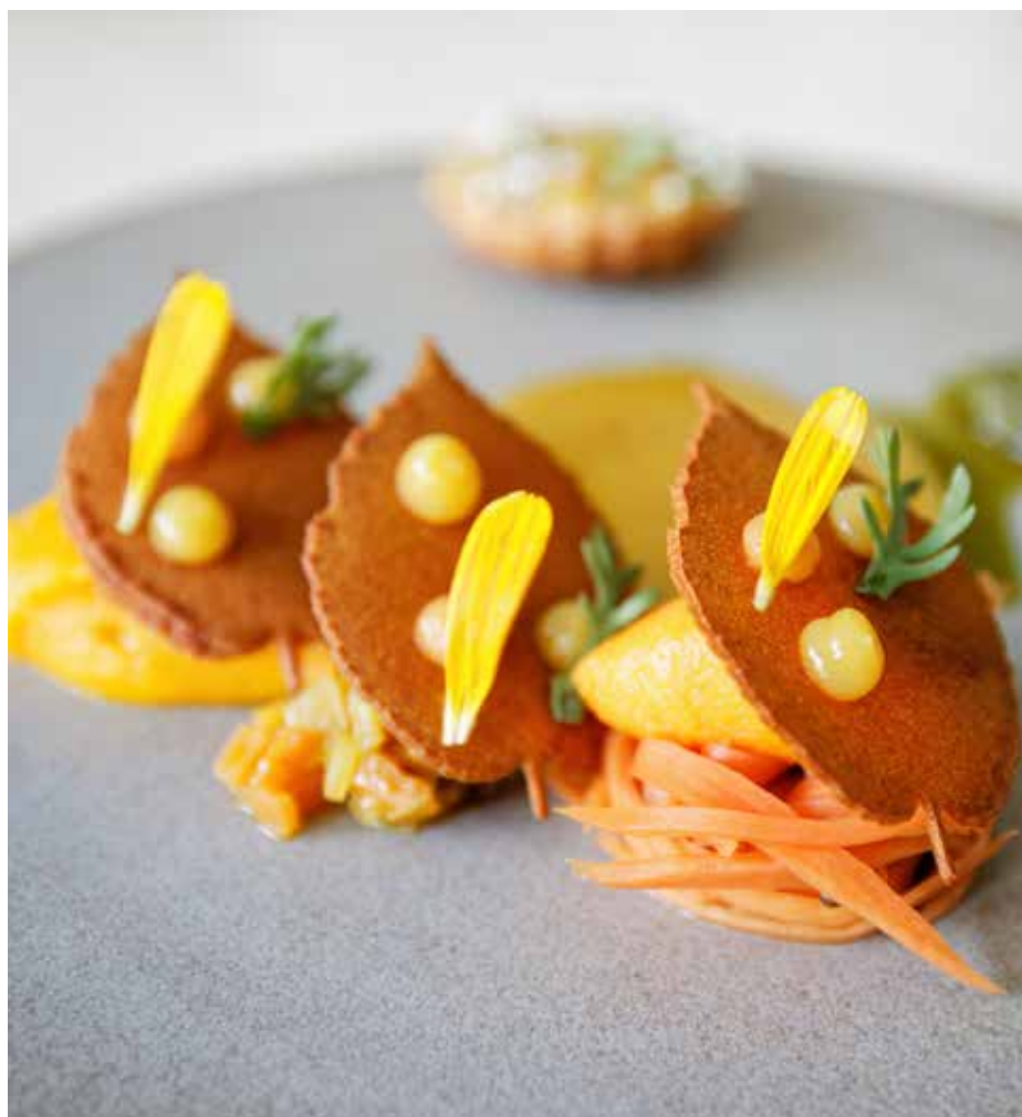
À La Luciole, la gastronomie est botanique

Au restaurant La Luciole, small is beautiful... et végan